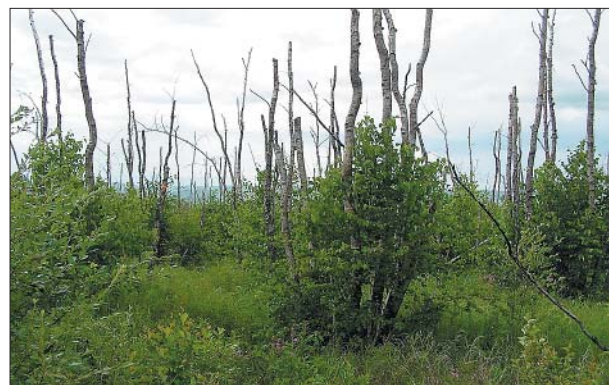
Рис. 4 – Возобновление берёзы после верхового пожара