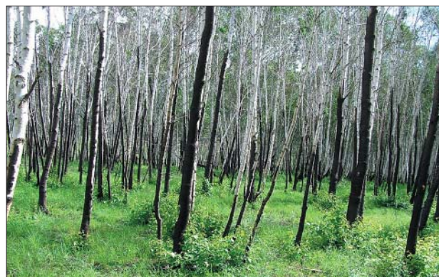
Рис. 3 – Возобновление берёзы после сильного низового пожара